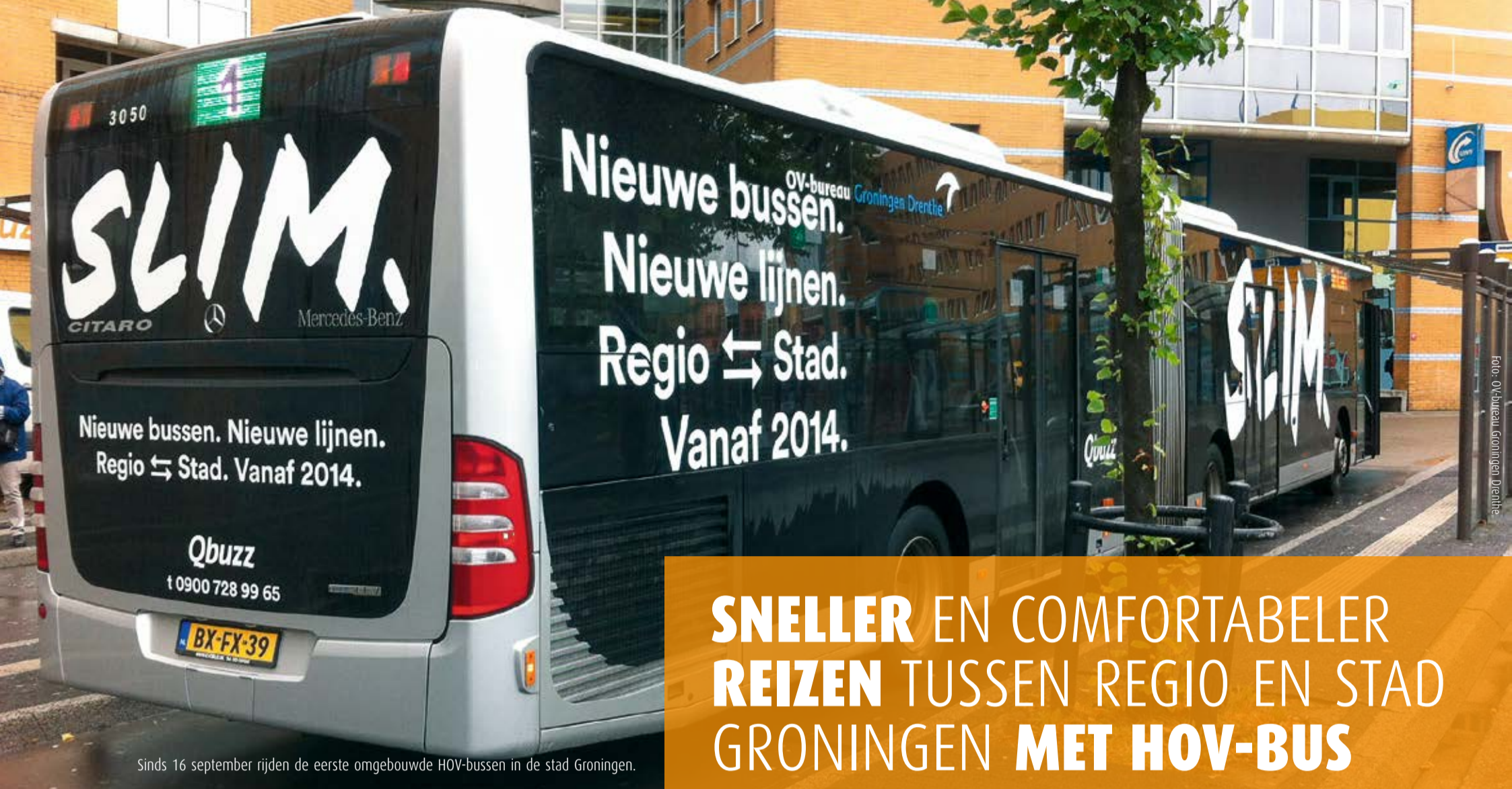
Sinds 16 september rijden de eerste omgebouwde HOV-bussen in de stad Groningen.